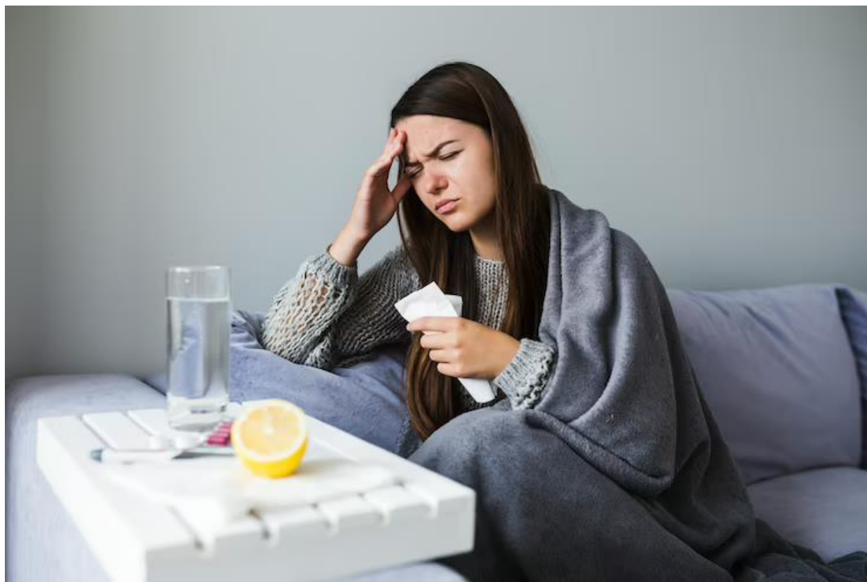
قرص استامینوفن: نحوه مصرف، دوز مجاز و عوارض

مصرف داروی استامینوفن باید به گونه‌ای انجام شود که افراد عوارض کمی را تجربه کنند. خوشبختانه این دارو نمی‌تواند آسیب شدیدی به دیواره معده شما وارد کند؛ چون برخلاف برخی از مسکن‌ها و ضدالتهاب‌ها مانند ایبروپروفن، تحریک‌کننده دیواره معده نیست. با این حال اگر می‌خواهید اقدام به مصرف قرص‌های حاوی استامینوفن کنید، با ما همراه باشید تا بیشتر در مورد این دارو و اثرات آن آشنا شوید.